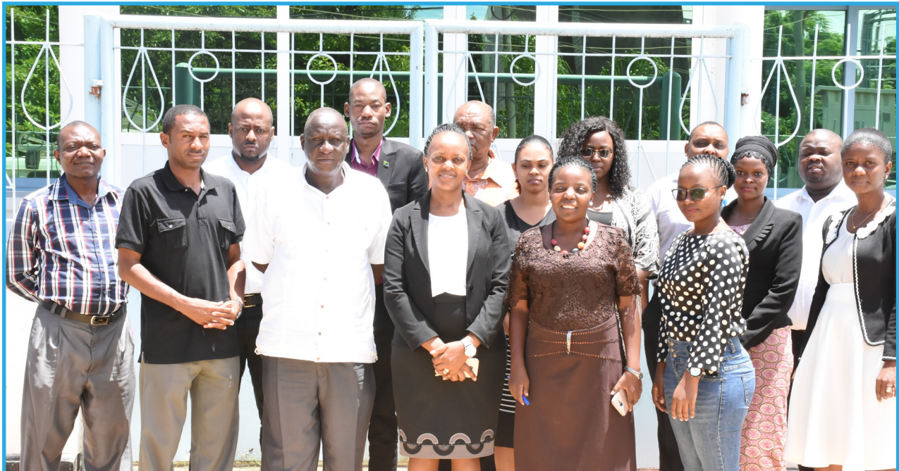
Wadau kutoka asasi za kiraia na vyombo vya habari wakiwa katika picha ya pamoja baada ya mkutano wa wadau kujadili ushiriki wa wananchi katika shughuli za kimaendeleo. Mkutano huo ulifanyika Ofisi za Makao Makuu ya LHRC mnamo Februari 2018.