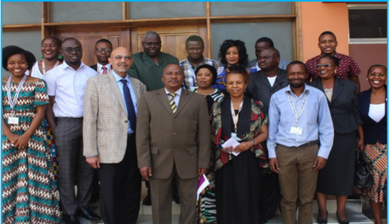
Timu ya Mtandao wa TECMN katika picha ya pamoja na Kamati ya Bunge ya huduma za kijamii

K ufuatia mkutano (TECMN) ukiwakutanisha uliondaliwa na wabunge wanawake wa mashirika 49 chini ya Bunge la Jamhuri ya Mtandao wa Kupinga Muungano wa Tanzania na Ndoa za Utotoni Tanzania wawakilishi wa mtandao