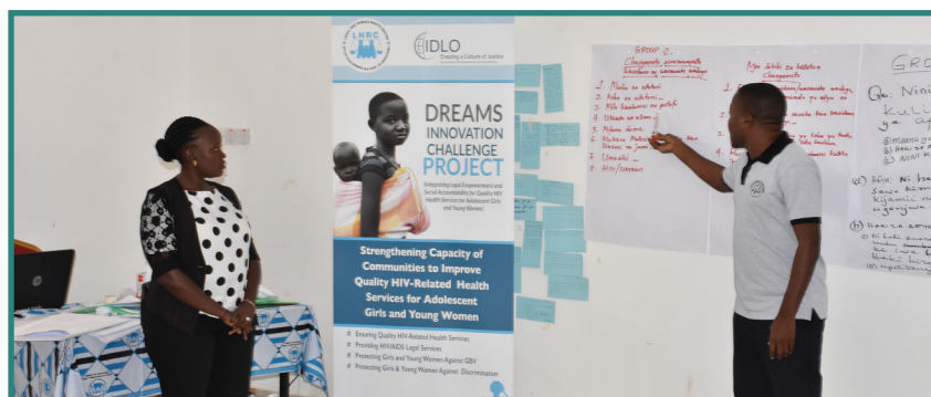
Washiriki wa Mafunzo kwa Watoa Huduma za Kisheria wakifanya mawasilisho baada ya majadiliano.

ya Kudhibiti UKIMWI Tanzania (TACAIDS), Shinyanga ni miongoni mwa mikoa inayoongoza kwa maambukizi ya VVU na Ukatili wa Kijinsi nchini ikiwa inashika nafasi ya sita kwa maambukizi ya VVU na nafasi ya kwanza kwa Ukatili wa Kijinsi. Dkt. Malale alitaja idadi ya watu wanaoishi na maambukizi ya VVU katika Manispaa ya Shinyanga kuwa 23,060 na kutanabaisha sababu za juhudi za kuzuia maambukizi mapya kulega kuwa ni pamoja na