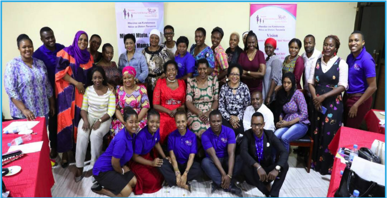
Timu ya Mtandao wa TECMN katika picha ya pamoja na Wabunge Wanawake

Sheria sambamba na kupitia mtandao wa kadhaa kwa lengo la Kamati ya Huduma za TECMN kituo kilishiriki kushirikiana na wadau Kijamii ambapo wote mkutano na Naibu Spika wengine kutoka ndani walikubaliana na lengo wa Bunge la Jamhuri ya na nje ya nchi katika la kampeni hiyo ambayo Muungano wa Tanzania kupinga ndoa za utotoni. ni kubadilisha kipengele uliofanyika Machi 2, 2018 Kituo kupitia mtandao cha umri katika Sheria katika ofisi ya Naibu Spika wa TECMN kimeshiriki ya Ndoa ya mwaka 1971 jijini Dar es Salaam kwa mikutano iliyofanyika kutoka umri wa msichana lengo la kufanya utetezi Uganda na Kenya kwa kuolewa kuwa miaka 15 kutokomeza ndoa za lengo la kuimarisha hadi miaka 18 sawa na utotoni. utetezi wa haki za watoto wa kiume. Pia Kituo cha Sheria wasichana kwa ukanda na Haki za Binadamu wa Afrika Mashariki. Sambamba na hilo, Kituo kimeshiriki mikutano