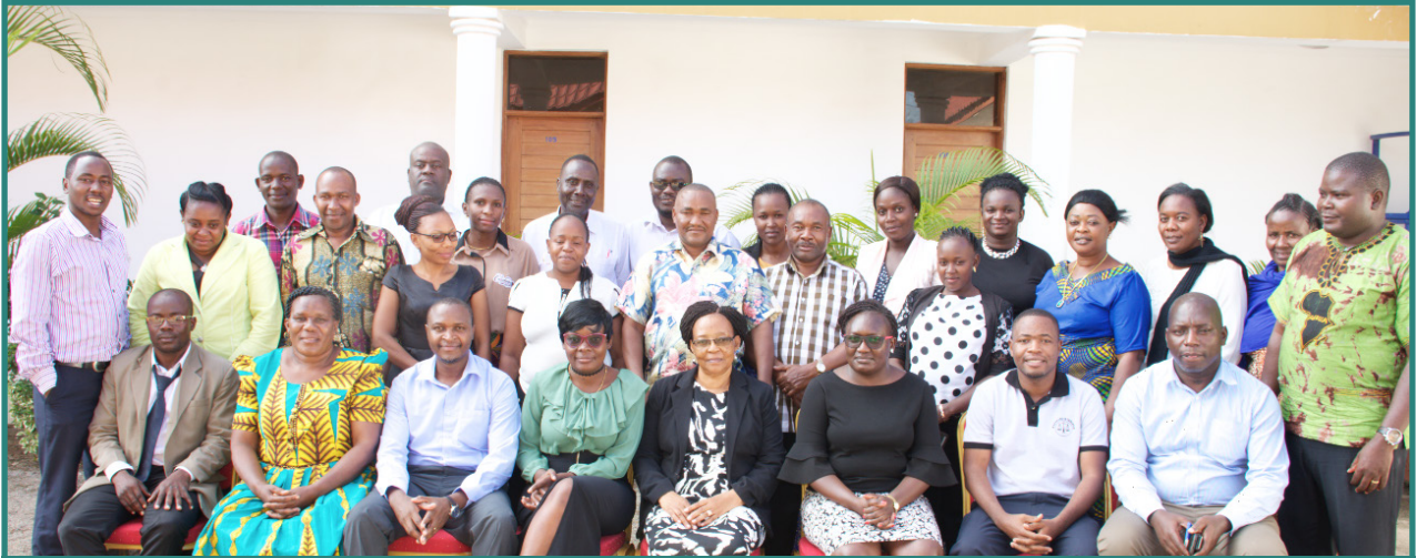
Watoa huduma za haki wa Manispaa ya Shinyanga wakiwa katika picha ya pamoja na wawakilishi wa LHRC na IDLO baada ya mafunzo.

kukosekana kwa kampeni za kutosha juu ya elimu ya afya ya UKIMWI, watu kutokuwa tayari kupima VVU na kuhudhuria huduma za afya, kukosekana kwa vituo vya kutosha vya vinavyotoa huduma ya afya ya UKIMWI sambamba na mila na desturi potofu juu ya VVU/UKIMWI.