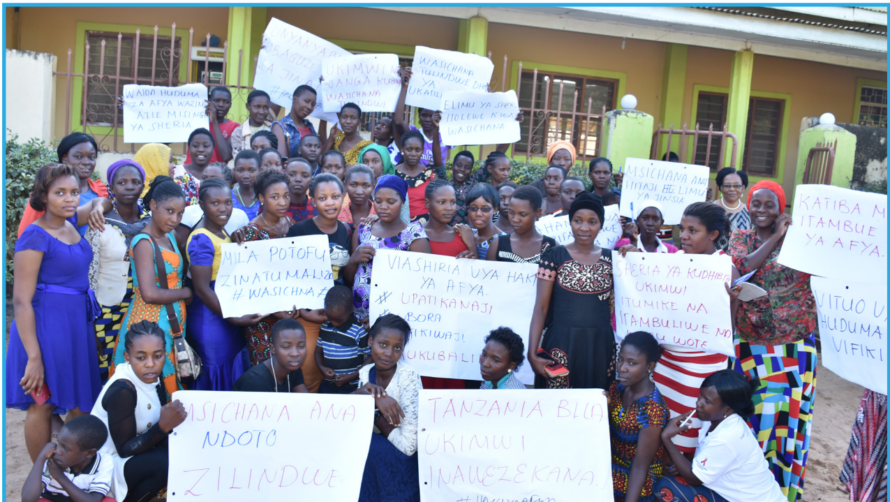
Wasichana na Wanawake Wadogo wilayani Kahama wakionesha mabango yenye ujumbe kuzitaka mamlaka kuboresha huduma za afya na UKIMWI mkoani Shinyanga