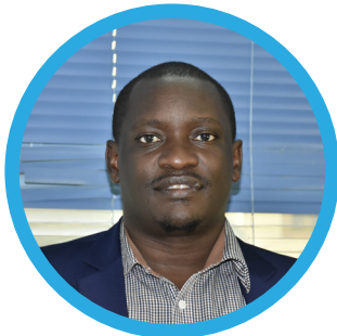
Paul Mikongoti Asifa Programu - Dawati la Utafiti