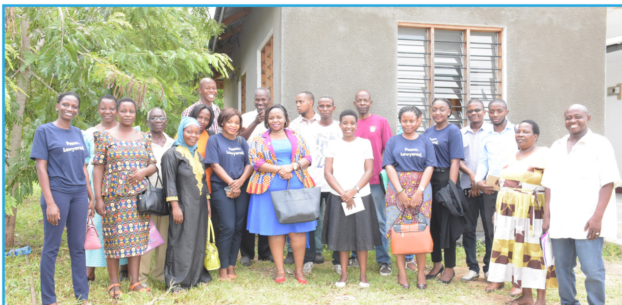
Timu ya wanasheria wa Kituo cha Sheria na Haki za Binadamu pamoja na wanasheria wa shirika la PLPG wakiwa katika picha ya pamoja na wasaidizi wa kisheria wa Kigamboni wakati wakitoa huduma ya msaada wa kisheria kama sehemu ya maadhimisho ya Siku ya Wanawake Duniani.