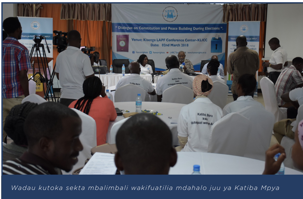
Wadau kutoka sekta mbalimbali wakifuatilia mdahalo juu ya Katiba Mpya

Sambamba na mdahalo huo Kituo pia kilifanya mdahalo uliowakutanisha wanafunzi ambao ni wananchama wa vilabu vya haki za binadamu katika Chuo Kikuu cha Mzumbe (Morogoro), Chuo Kikuu cha Dodoma na Chuo cha St. John. Katika mdahalo huo uliofanyika Morogoro Februari 11, 2018 na kuhudhuriwa na jumla ya wanafunzi 412. Washiriki walionesha shauku ya kupata Katiba mpya.