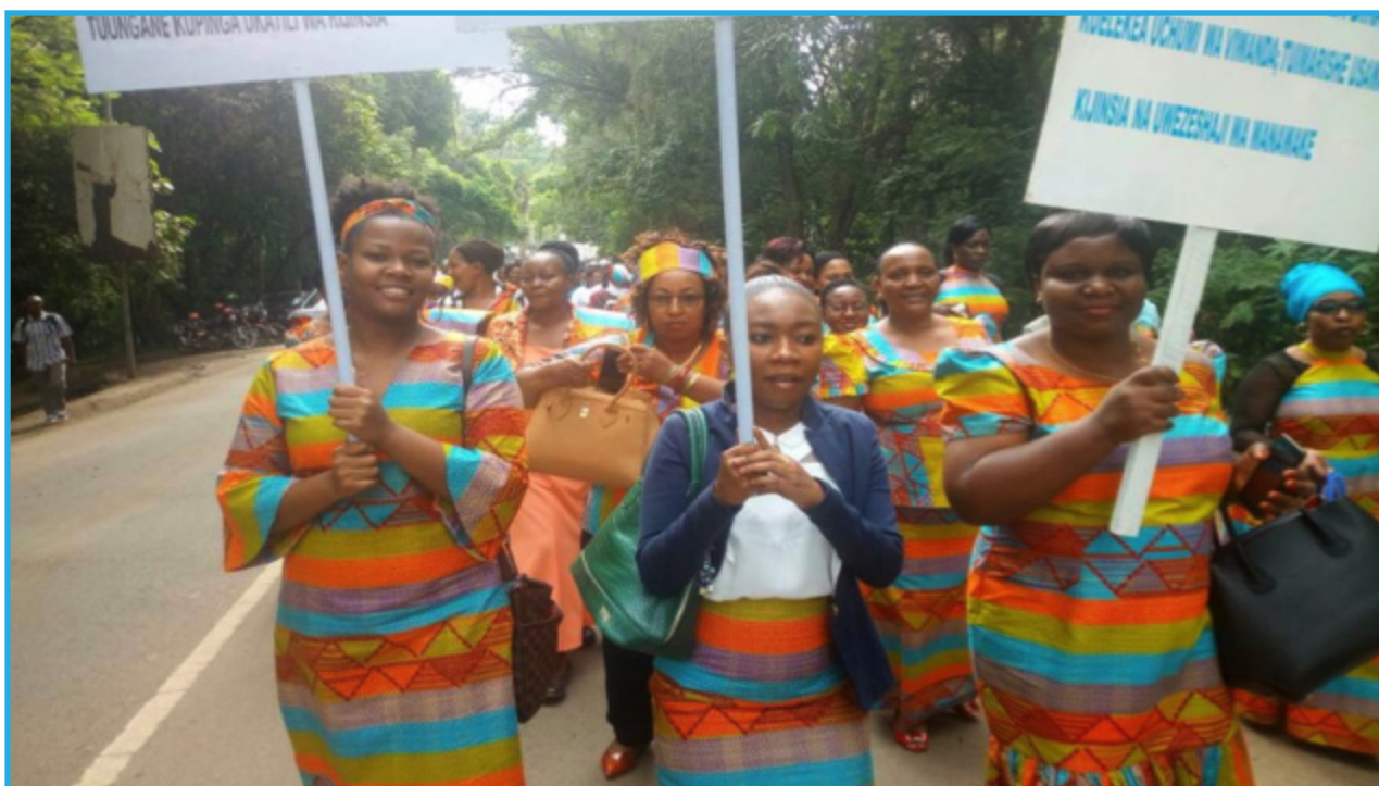
Wafanyakazi wa LHRC wakiongoza maandamano kuadhimisha Siku ya Kimataifa ya Wanawake jijini Arusha.