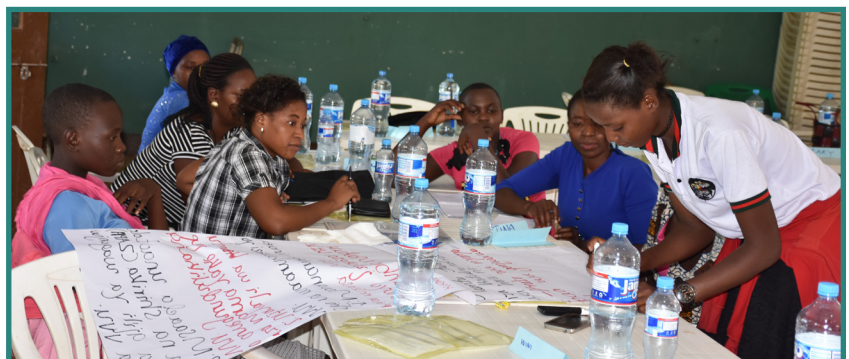
Wasichana na Wanawake Wadogo wakiwa katika majadiliano ya vikundi wakati wa mafunzo kuhusu Haki za Binadamu, Ukatili wa Kijinsia na UKIMWI katika Manispaa ya Shinyanga.

LHRC inatekeleza Mradi Dreams Innovation Challenge katika Halmashauri ya Mji wa Kahama na Halmashauri ya Manispaa ya Shinyanga