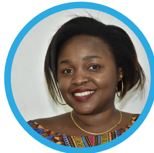
Naemy Sillayo Afisa Programu - Dawati la Jinsia na Watoto