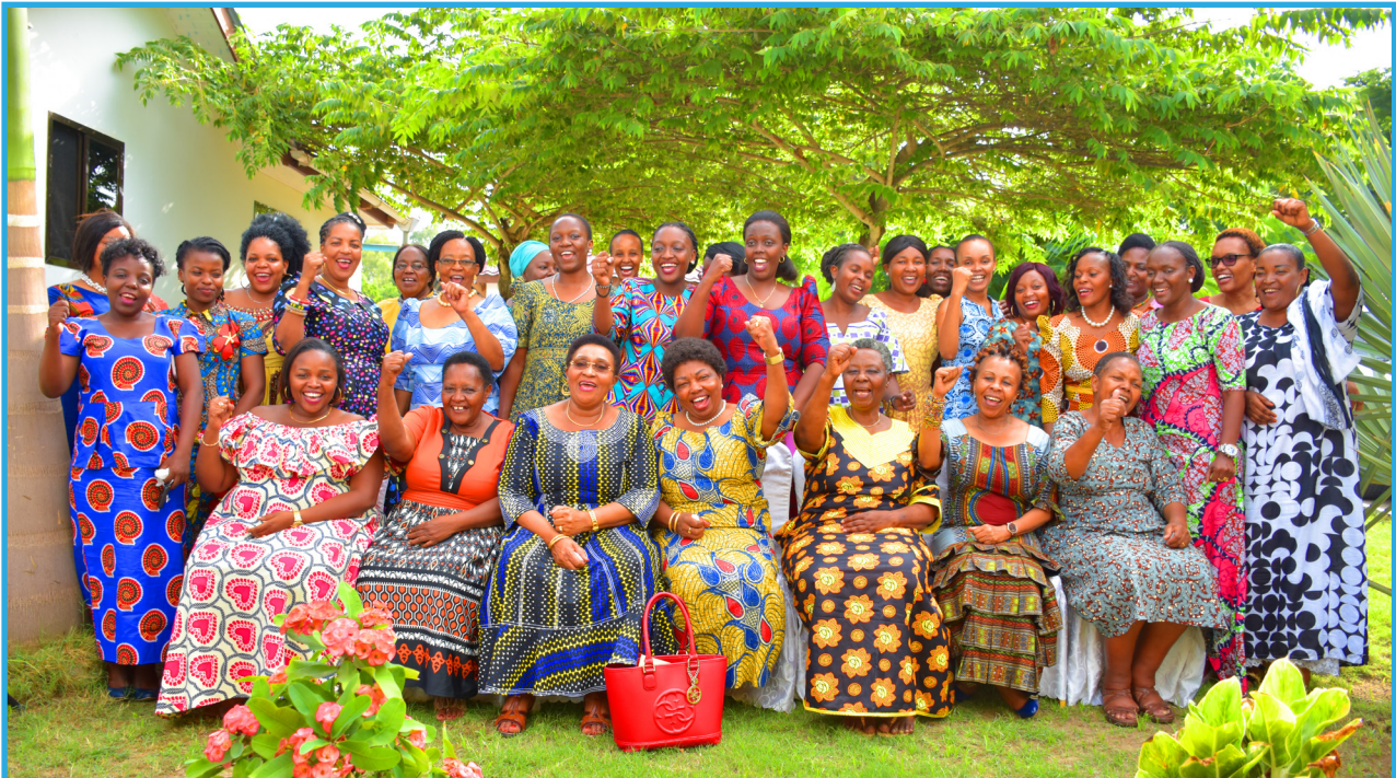
Wanawake tunaweza! Wanawake wakionyesha ishara ya nguvu na uwezo walionao katika kufanya mambo mbalimbali wakati wa hafla ya maadhimisho ya Siku ya Wanawake.