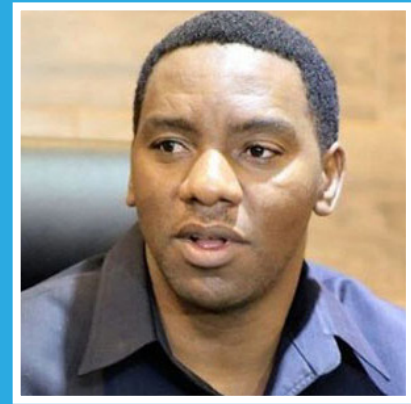
Mkuu wa Mkoa wa Dar es Salaama Paul Makonda