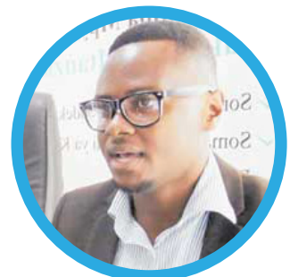
Fundikira Wazambi Afisa Programu - Dawati la Utafiti